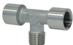
Racores estándar en acero inoxidable AISI 316L, roscas de 1/8" a 1/2"