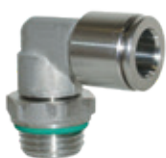
Racores automáticos en acero inoxidable AISI 316L, tubo de Ø 4