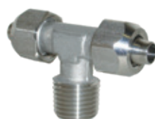
Racores de enchufe semirápido en acero inoxidable AISI 316L, tubo de Ø 6 a Ø 10 mm, rosca de 1/8" a 1/2"