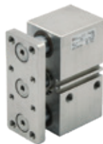
Cilindros especiales en acero inoxidable