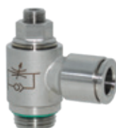
Reguladores de caudal en acero inoxidable AISI 316L, roscas de 1/8" a 1/2"