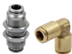
Racores automáticos en latón sin plomo serie F, tubo de Ø 4 a 10 mm,