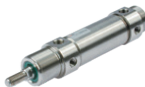
Cilindros en acero inoxidable redondos, diámetros de 32 a 63 mm