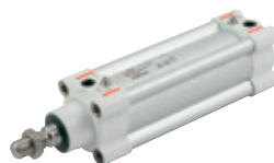
Cilindros serie HCR, High Corrosion Resistance (alta resistencia a la corrosión), norma ISO 15552, diámetros de 32 a 125 mm