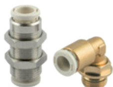
Racores automáticos en latón sin plomo serie F-E PLUS y F-NSF PLUS, tubo de Ø 4 a 10 mm, rosca de M5 a 1/2"