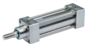
Cilindros en acero inoxidable norma ISO 15552, diámetros de 32 a 125 mm