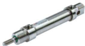
Cilindros en acero inoxidable norma ISO 6432, diámetros de 16 a 25 mm